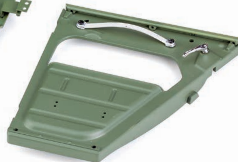
Общий вид внешней и внутренней частей задней правой двери

Шаг 3. Разместите накладку на верхней плоскости внутренней части задней правой двери из выпуска 125. Закрепите деталь с внутренней стороны двери тремя винтами 1,7×4 (DP).